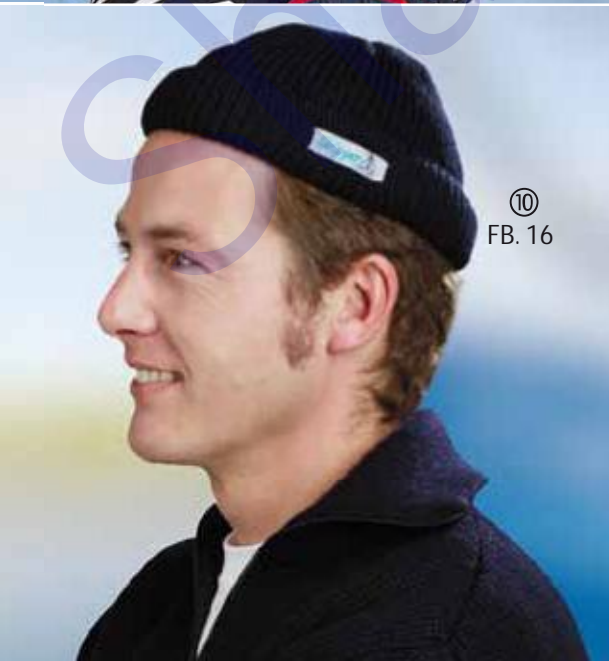
⑩ FB. 16

⑤ Art. 1070 Muts Klassiek gebreid model, gunstig geprijsd Materiaal: 100% polyacryl Kleur: (16) marine Art. 1074 Muts Robuuste klassieke muts Materiaal: 80% wol / 20% polyacryl Kleur: (16) marine Art. 1078 Muts Hoogwaardige klassieke muts Materiaal: 100% wol Kleuren: (01) wolwit, (16) marine (90) zwart