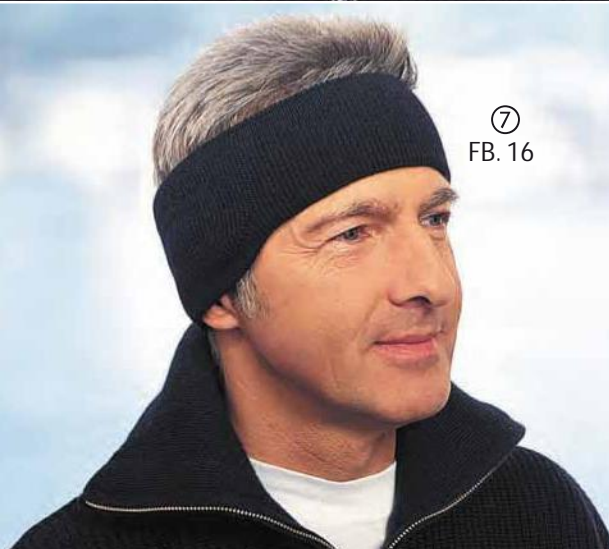
⑦ FB. 16