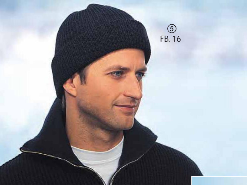
⑤ FB. 16