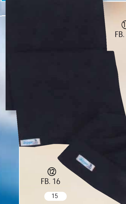
⑪ FB. 16