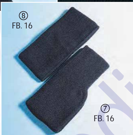
⑧ FB. 16