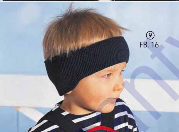
⑨ FB. 16