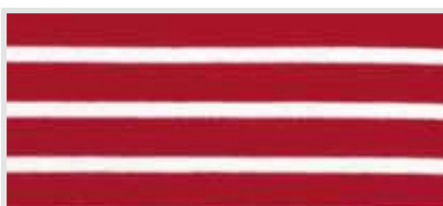
(02) rood / wit gestreept