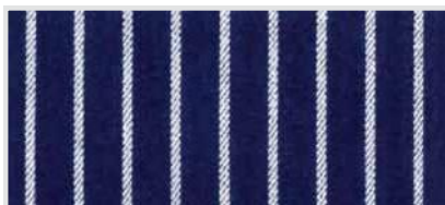
(10) brede strepen