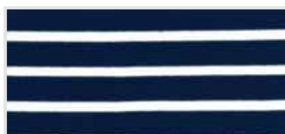
(05) marine / wit gestreept