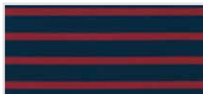
(13) marine / rood gestreept