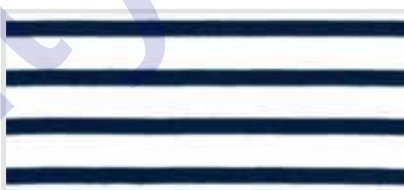
(04) wit / marine gestreept