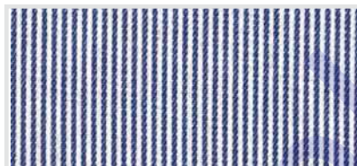
(12) lichte strepen