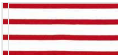
(03) wit / rood gestreept