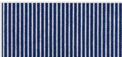
(11) smalle strepen